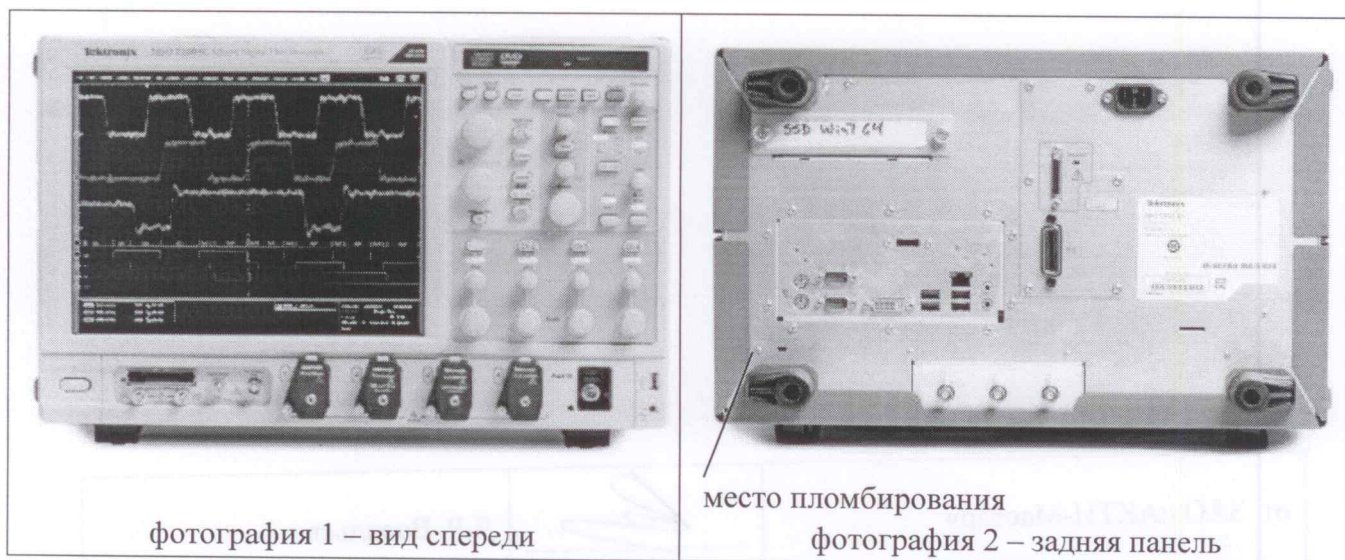
фотография 1 – вид спереди

Конструктивно осциллографы цифровые DPO72304DX, DPO72504DX, DPO73304DX, MSO72304DX, MSO72504DX, MSO73304DX выполнены в виде моноблока в настольном исполнении, их внешний вид показан на фотографиях 1 и 2.