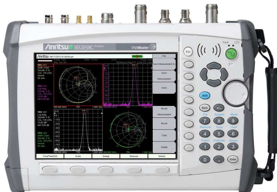
Фотография 2. Лицевая панель MS2026C, MS2028C, MS2036C, MS2038C