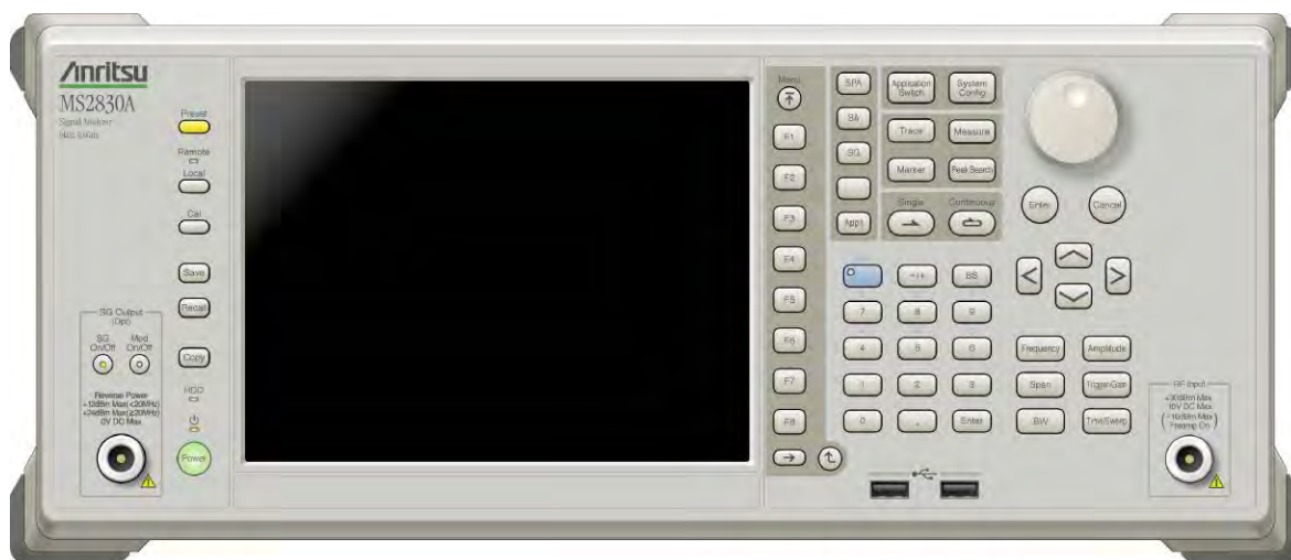
Фотография 1. Лицевая панель

Общий вид анализаторов сигналов MS2830A-044, MS2830A-045 показан на фотографии 1, вид задней панели с обозначением места пломбирования от несанкционированного доступа (путем нанесения специальной краски под винт) показан на фотографии 2. Знак поверки в виде наклейки размещается в середине боковой панели.