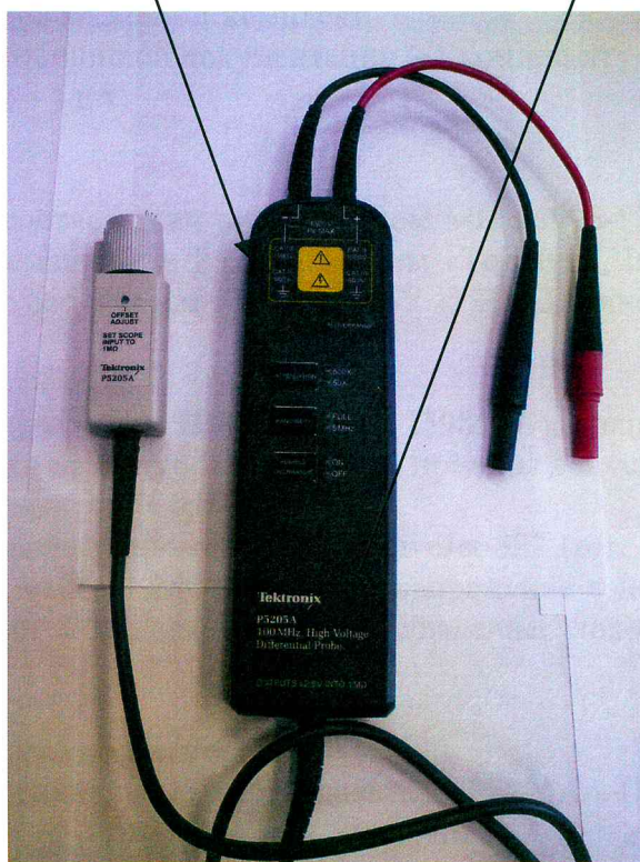
Рисунок 1 – Внешний вид пробника