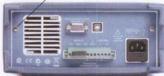
фотография 2 – задняя панель