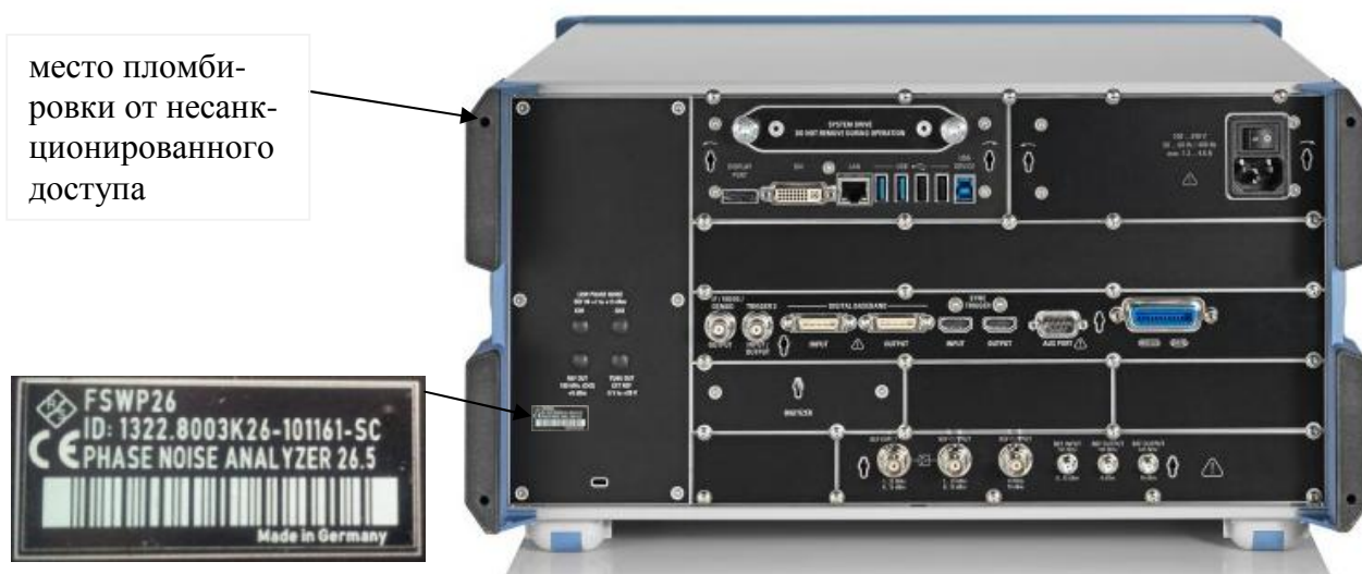
Рисунок 2 - Схема пломбировки от несанкционированного доступа и размещения наклеек