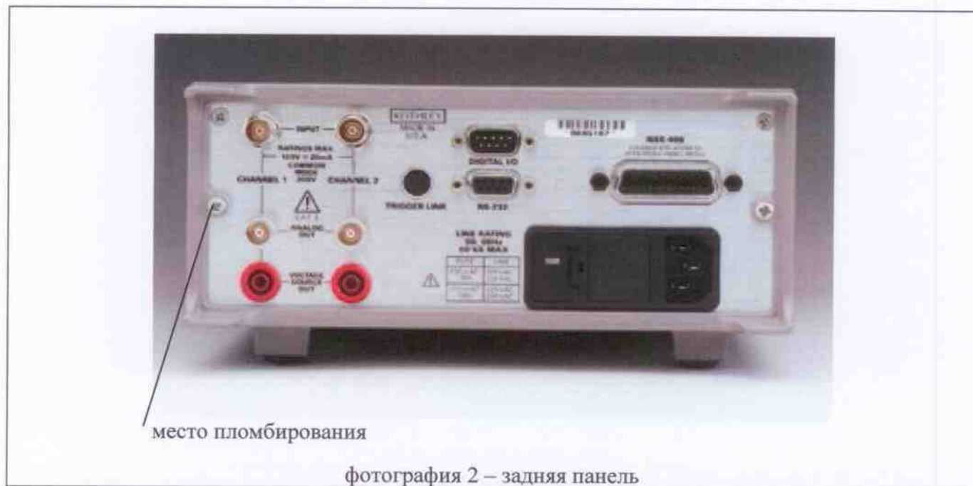
фотография 2 – задняя панель

По условиям эксплуатации пикоамперметры с источником напряжения двухканальные Keithley 2502, Keithley 6482 соответствуют группе 3 ГОСТ 22261-94.